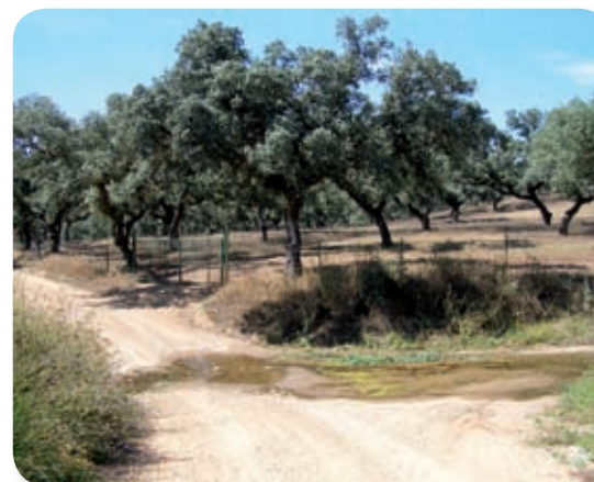
La dehesa es un bosque aclarado para aprovechamientos múltiples (ganadero, agrícola, forestal...), en la que se conservan muchos de los valores naturales del bosque mediterráneo original.

Avanzamos entre muros de piedra que nos separan de huertos y otros cultivos, que nos revelan la antigüedad del camino y nos evocan modos de vida del pasado. También vemos líneas de chumberas, que son otro tipo de cercado tradicional. Pasados los cultivos, entramos en los dominios de las dehesas, la formación más característica del parque natural.