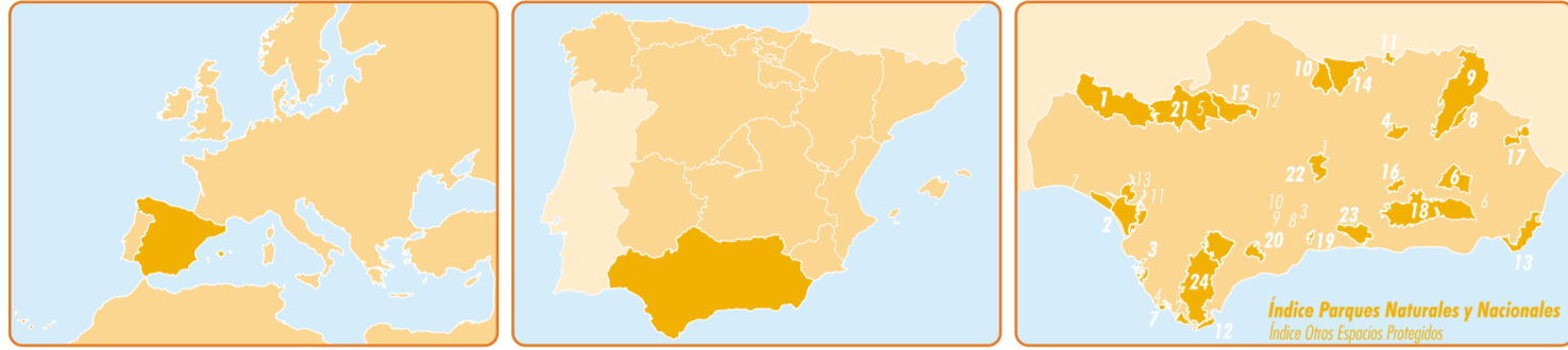
Índice Parques Naturales y Nacionales Índice Otros Espacios Protegidos